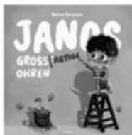
Janos gross(e) artige Ohren