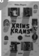
Das Krimskrams Reich