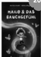
Mailo und das Bauchgefühl