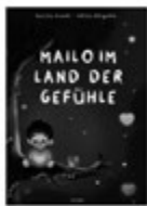
Mailo im Land der Gefühle